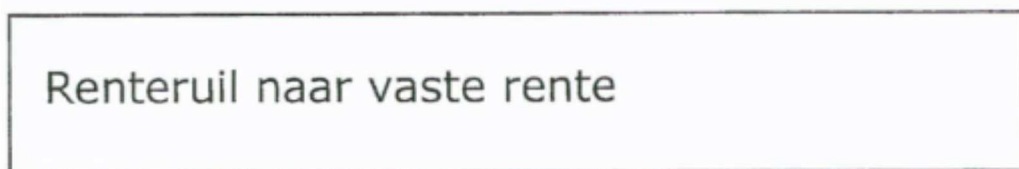
Figuur 1: Uw rentestromen

Een renteruil is een uiterst flexibel instrument en kan geheel naar uw wensen worden ingericht. Zo kan er gekozen worden voor een andere looptijd of een andere hoofdsom. De renteruil kan overigens op elk moment worden beëindigd. Op basis van de dan geldende marktomstandigheden zal worden vastgesteld welk bedrag u hiervoor terug krijgt of juist dient te betalen.